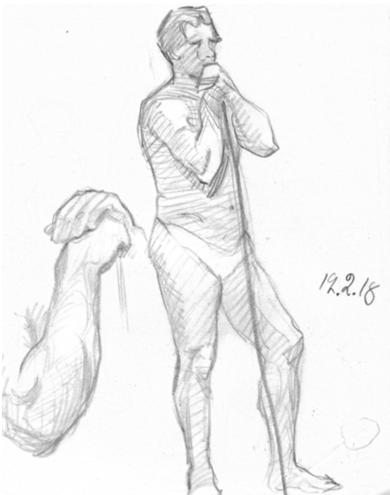
Den manliga modellen är minsann inte naken! Det ansågs kanske alltför avancerat inför kvinnliga teknare år 1918.